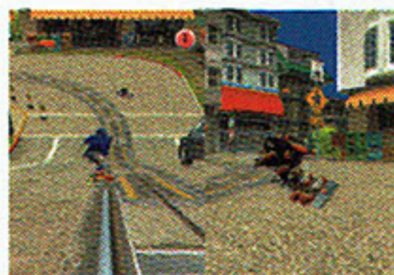
◀ソニックVSシャドウ